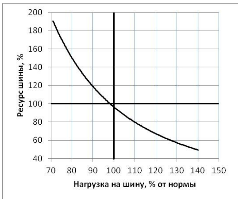
Зависимость ресурса шин от нагрузки