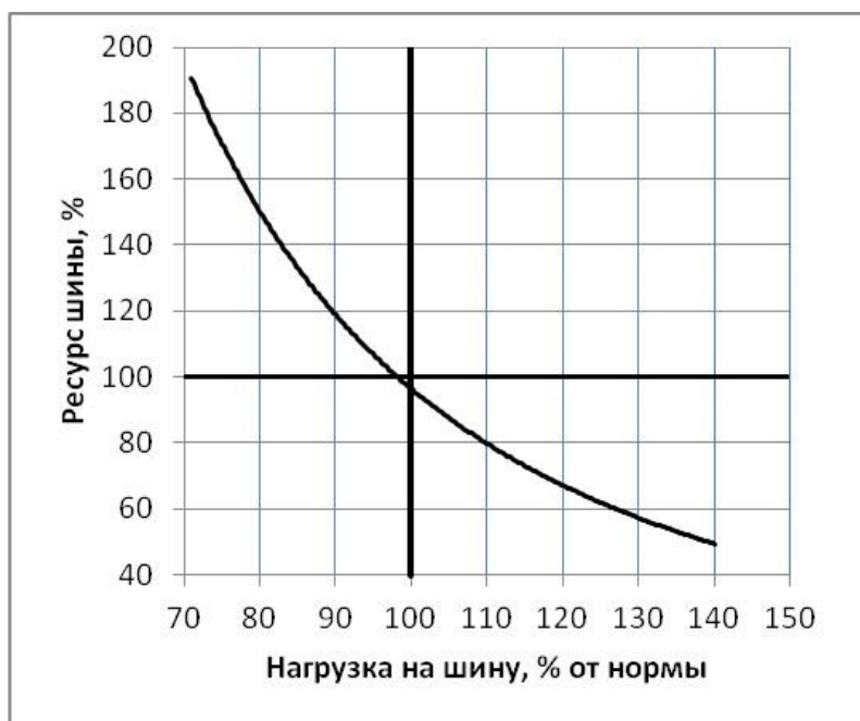
Зависимость ресурса шин от нагрузки