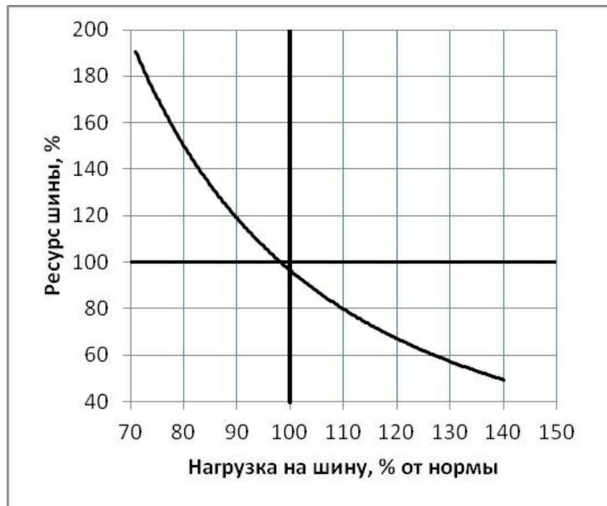
Зависимость ресурса шин от нагрузки

Претензии потребителей рассматриваются по адресу: